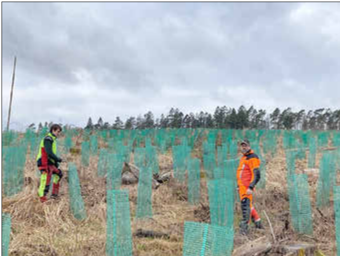
Ihr Forstteam der Stadt Wolfhagen

Sie benötigen lediglich Handschuhe, um die weitere Ausrüstung kümmern wir uns.