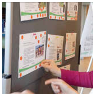
Kinder und Jugendliche während der Projektabstimmung beim Jugendtag in Vellmar im März 2023

Am 14. März lädt die Partnerschaft für Demokratie im Landkreis Kassel zur „Movie Night!“ in den Kulturladen Wolffhagen ein. Jugendliche und junge Erwachsene bis 27 Jahre aus der Region sind herzlich eingeladen, ab 17 Uhr über lokale Projekte abzustimmen, die ihre Freizeitgestaltung direkt betreffen.