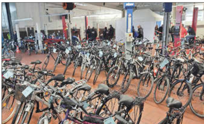
Viele Fahrräder warten in der Kfz-Werkstatt auf neue Besitzer.

„Wir gehen davon aus, dass es wie in den vergangenen Jahren wieder einen Ansturm auf die Räder geben wird, so MSC-Pressesprecher Peter Kranz. Die Verkaufsfläche war immer bis auf den letzten Meter belegt. Ab Verkaufsbeginn finden die meisten Artikel schnell einen neuen Besitzer. So mancher wird auch an diesem Tag ein richtiges Schnäppchen machen.“