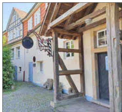
Erzählcafé in der Zehntscheune

Das Team vom Regionalmuseum Wolfhager Land lädt Sie für Sonntag, den 10. März um 15 Uhr herzlich in seine Zehntscheune ein zu einem Erzählcafé. In gemütlicher Runde bei Keksen und Kuchen wollen wir uns über das Thema Magie und Aberglaube austauschen. In welcher Weise erleben wir heute noch magische Momente? Wie stark prägt Aberglaube unser Leben und gibt es spezielle Geschichten, die mit Magie und Aberglaube im Wolfhager Land zu tun haben, die in der Gegend ‚rumgeistern‘? Wir machen uns häufig nicht klar, wie sehr uns alte Sprüche und Gewohnheiten beeinflussen. Das fängt damit an, dass es in unseren modernen ICEs keine Wagen mit der Nummer 13 gibt, da die Zahl 13 Unglück bringen soll. Wer weiß nicht, dass ein vierblättriges Kleeblatt Glück bringt, wer kennt nicht sein Sternzeichen, hat noch nie sein Horoskop gelesen oder noch nie auf Holz geklopft. Die Ergebnisse des Nachmittags sollen in die nächste Sonderausstellung unseres Museums ‚Magie und Aberglaube im Mittelalter‘ einfließen. Sie wird am Donnerstag, den 25. April eröffnet.