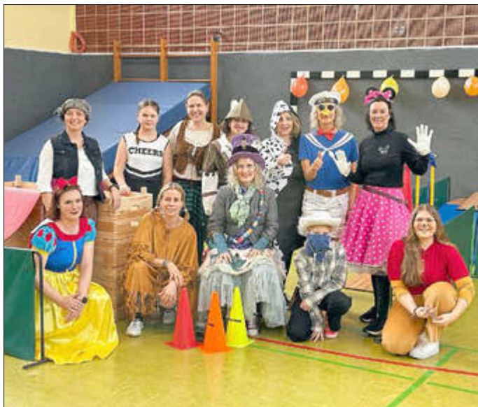
Eine mega Party war der Kinderkarneval am Karnevals-Wochenende beim TSV. Hier auf dem Bild die Organisatorinnen.