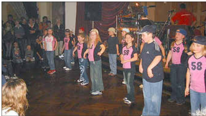
Streetdance Anno 2004, damals hieß das jährliche Event vom TSV noch Kameradschaftsabend.