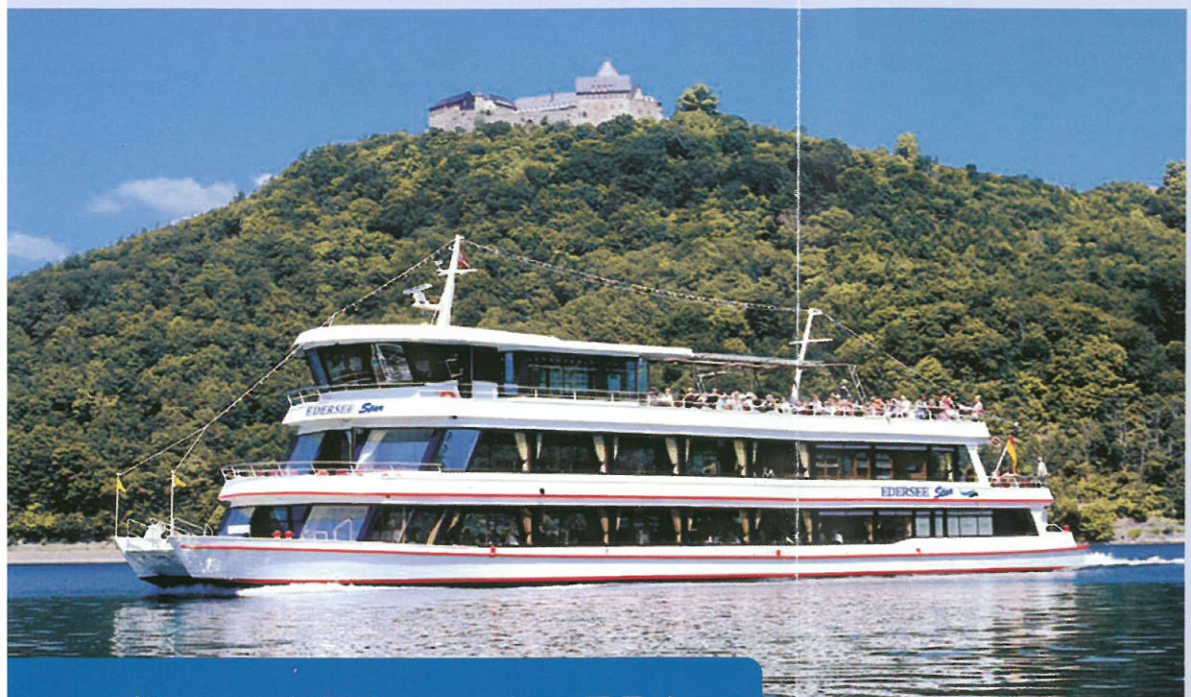
Kassel-Edersee – 70 km

Radfahren durch eine bezaubernde Landschaft.