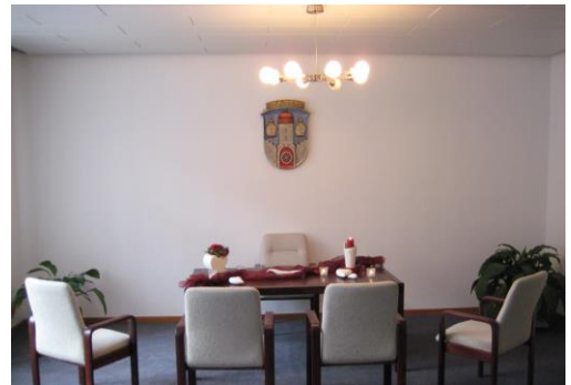
Trauzimmer im Rathaus in Naumburg (bis zu 20 Personen)

Wir haben Ihr Interesse geweckt und Sie haben sich für uns entschieden? Dies freut uns sehr, denn Sie werden es nicht bereuen. Ihre Eheschließung kann zwischen Montag und Samstag nach Absprache erfolgen. Für Terminvereinbarungen oder Fragen steht Ihnen das Team des Standesamts Wolfhager Land zur Verfügung und berät Sie gern für den schönsten Tag in Ihrem gemeinsamen Leben.