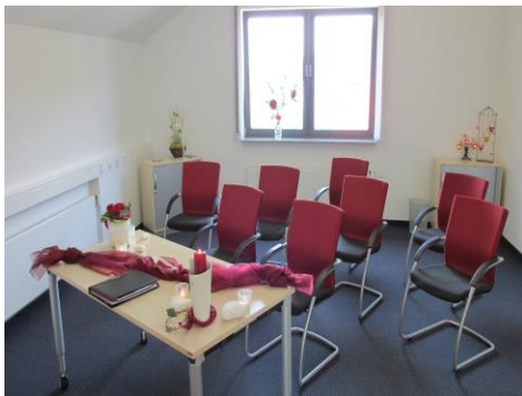
Trauzimmer im Rathaus in Habichtswald (bis zu 30 Personen)