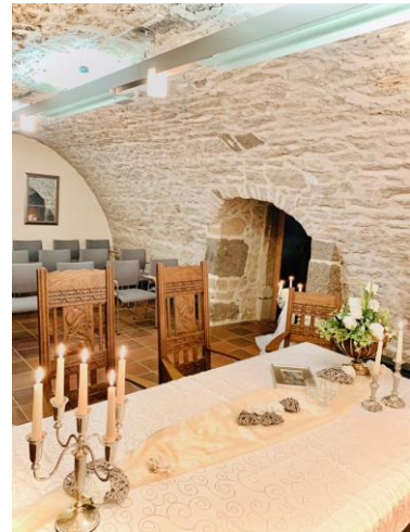
Gewölbekeller im Zierenberger Rathaus (bis zu 25 Personen)