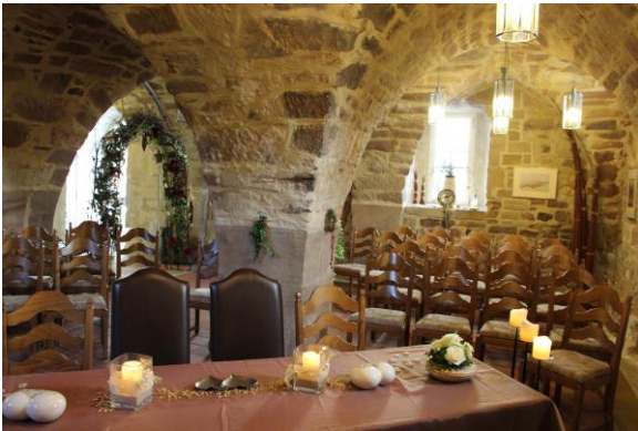
Grimms Märchenkeller im Alten Rathaus in Wolfhagen (bis zu 30 Personen)

Lassen Sie sich von unseren Trauzimmern im Märchenland der Brüder Grimm verzaubern.