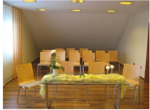
Trauzimmer im Rathaus in Bad Emstal (bis zu 15 Personen)